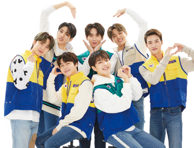
RCY 홍보대사 펜타곤